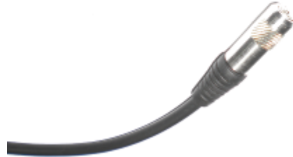
Малогабаритный преобразователь для контроля толщины гальванических и диэлектрических покрытий

Датчики (преобразователи) изготавливаются по заказу потребителя, учитывая его требования к особенностям исполнения датчика, точности измерения и удобству работы с преобразователем (датчиком).