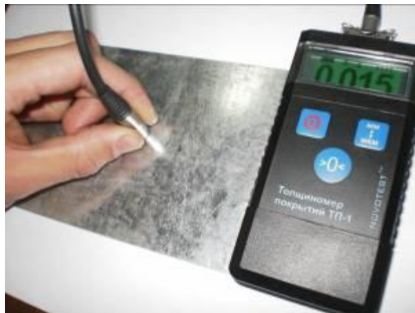
Измерение толщины гальванических покрытий