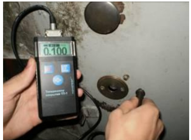
Измерение толщины лакокрасочных покрытий