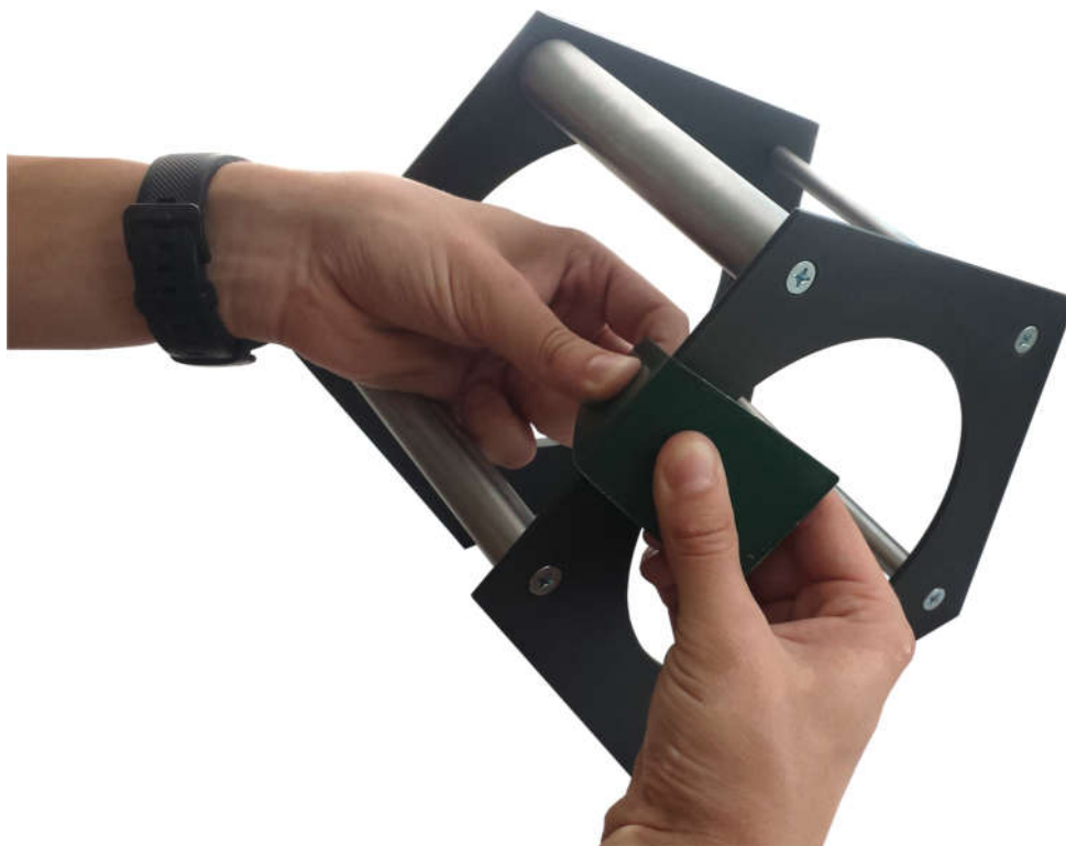
Рисунок 2.2 – Проведение испытания на грани прибора