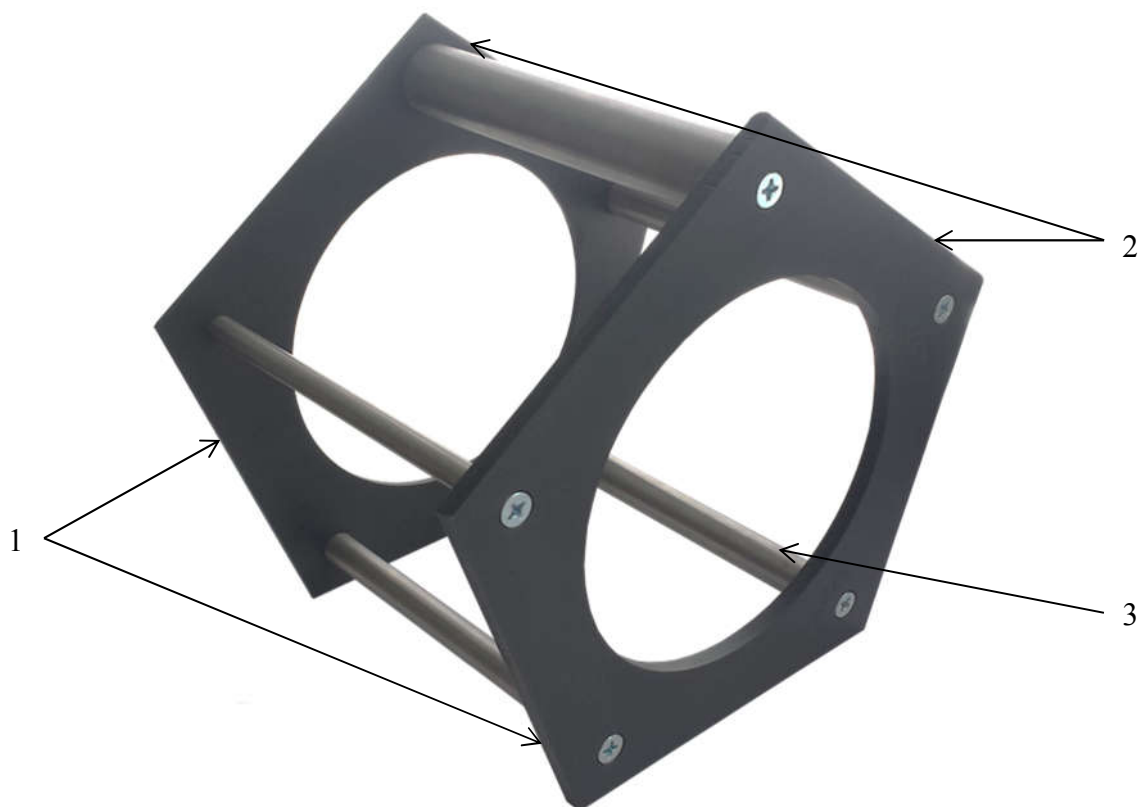
1 – пятиугольные металлические пластины; 2 – испытательные грани; 3 – испытательный стержень.