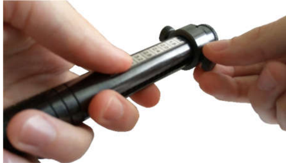
Рисунок 2.4 – Освобождение кольца-указателя