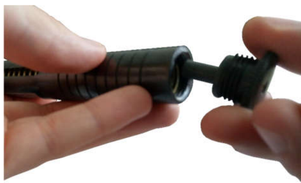
Рисунок 2.3 – Вкручивание заглушки с индентором