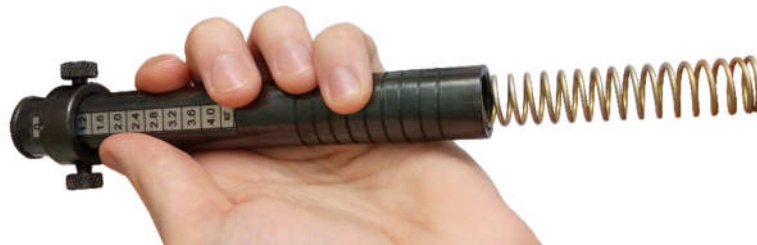
Рисунок 2.2 – Установка пружины