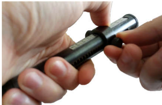
Рисунок 2.5 – Установка нагрузки