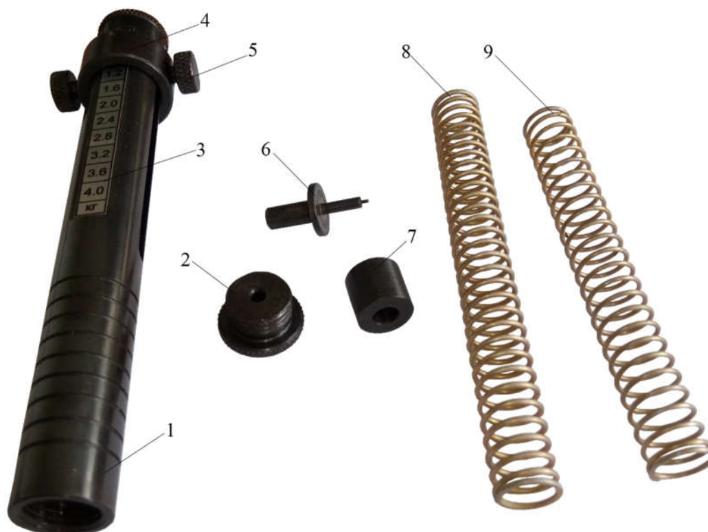
1 – корпус; 2 – заглушка; 3 – шкала; 4 – кольцо-указатель нагрузки; 5 – фиксаторы; 6 – индентор; 7 – дополнительная втулка (для пружины № 1); 8 – пружина № 2; 9 – пружина № 1.