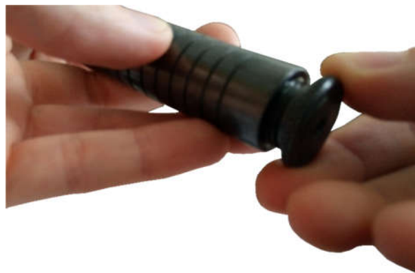
Рисунок 2.1 – Откручивание заглушки