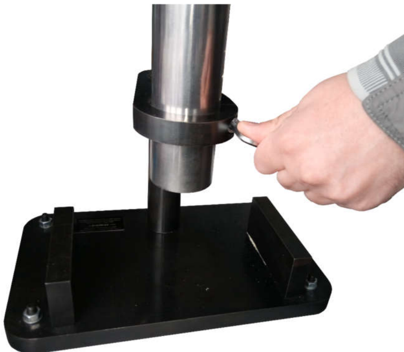
Рисунок 2.1 – Освобождение направляющей трубы