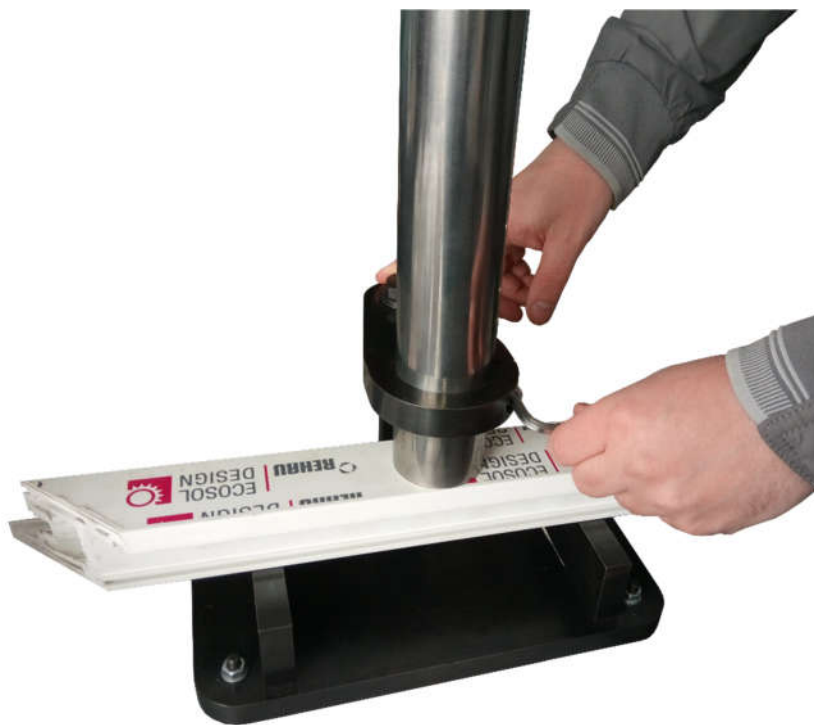
Рисунок 2.4 – Фиксация направляющей трубы

5. Зафиксировать направляющую трубу с помощью винта (рис. 2.4).