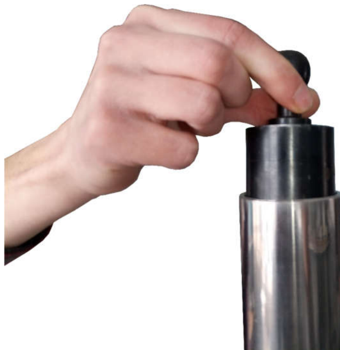
Рисунок 2.5 – Сброс бойка на образец

6. Сбросить боек на образец по направляющей трубе (рис. 2.5).