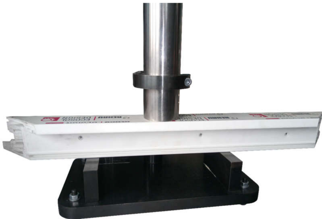
Рисунок 2.3 – Установка направляющей трубы на образец