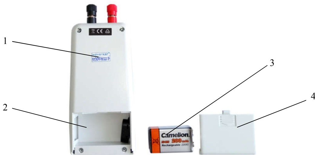
1 – серийный номер прибора; 2 – батарейный отсек; 3 – аккумуляторная батарея «Крона»; 4 – крышка отсека размещения батареи.

Для заряда аккумуляторной батареи необходимо воспользоваться зарядным устройством. Запрещается оставлять зарядное устройство во время заряда аккумулятора без присмотра.