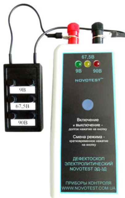
Рисунок 1.3 – Подключение блока тестирования к прибору

Для проверки работоспособности прибора необходимо к клеммам электронного блока подключить клеммы блока тестирования (рис. 1.3).