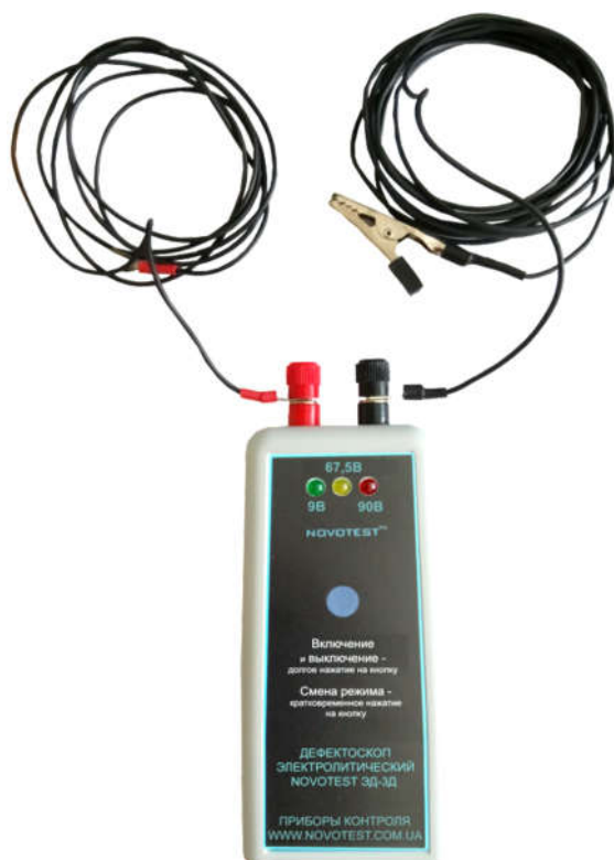
Рисунок 2.3 – Подключение соединительных кабелей №1 и №2 к электронному блоку электролитического дефектоскопа NOVOTEST ЭД-3Д