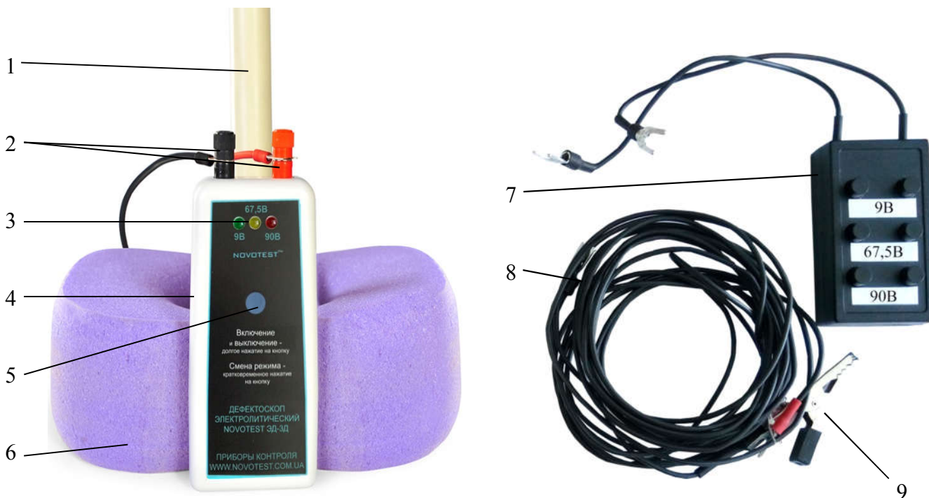
1 – электрод-держатель; 2 – клеммы для подключения соединительных кабелей; 3 – индикация выбранного режима; 4 – электронный блок; 5 – кнопка «Включение и выключение /смена режима»; 6 – губка; 7 – блок тестирования; 8 – комплект соединительных кабелей №1 и №2; 9 – зажим типа «крокодил».

Для проверки работоспособности прибора, в комплектации прибора присутствует блок тестирования режимов работы дефектоскопа.